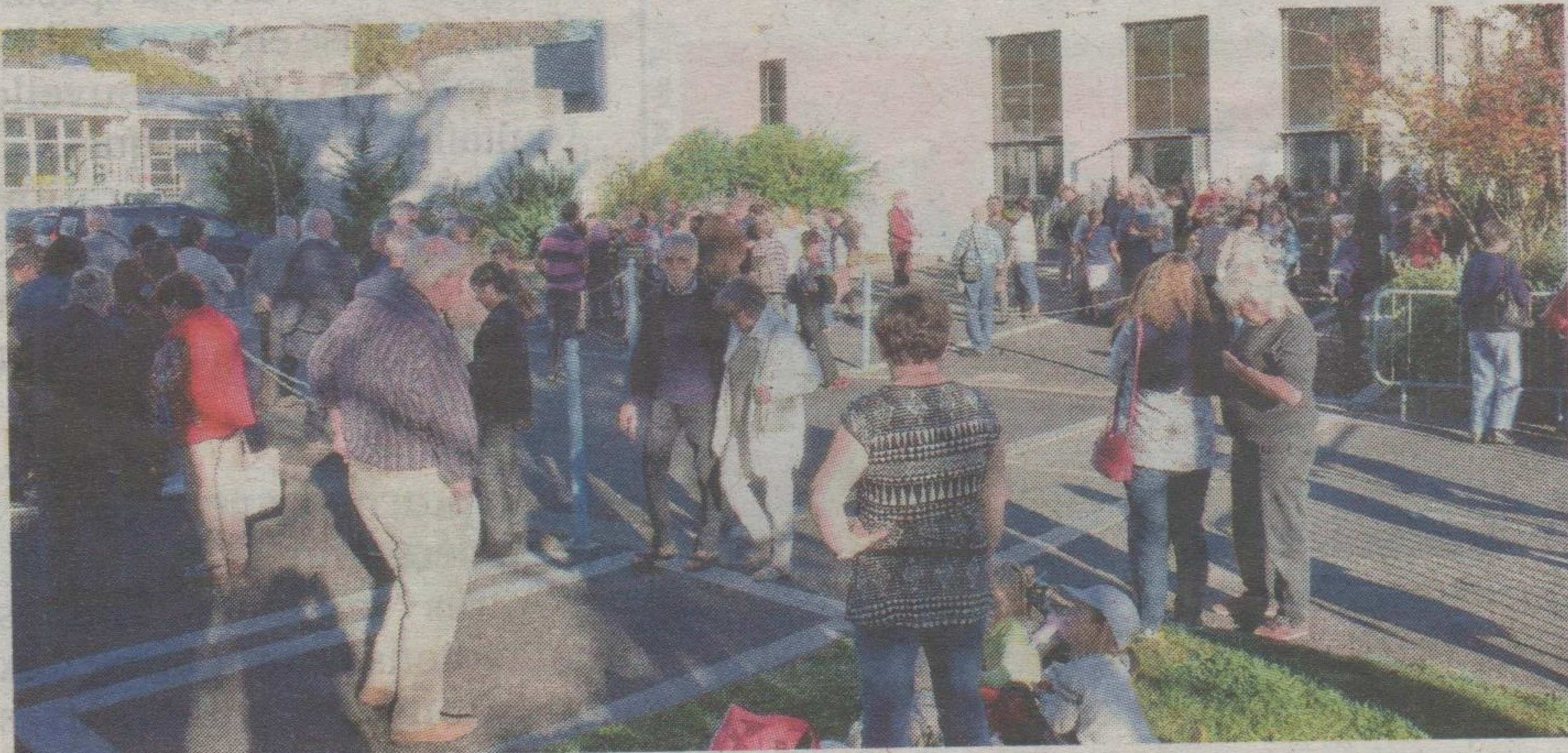
Beaucoup de monde pour assister aux séances de projection de samedi et de dimanche.