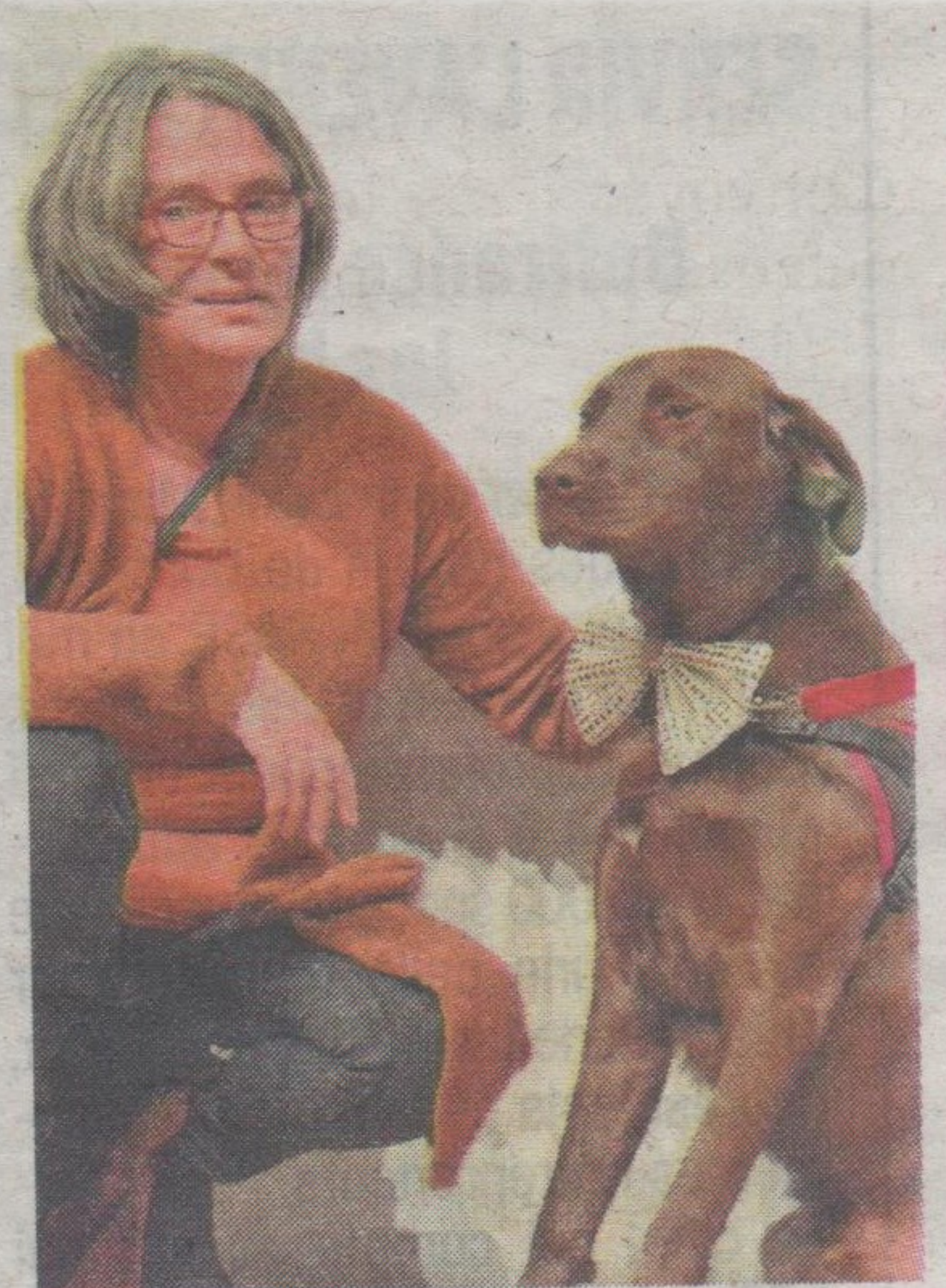
Le chien Louki, vedette du film du même nom est monté sur scène en tenue de soirée pour remercier le public.